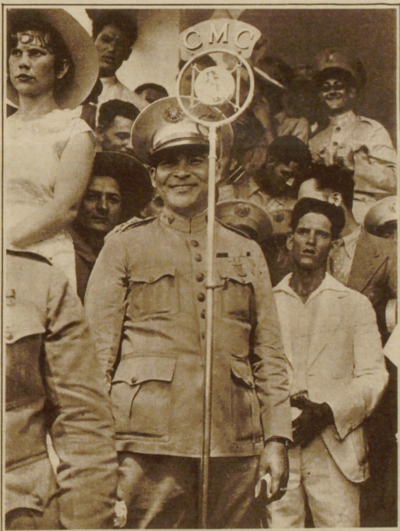
Hauptmann Battista hielt auf einer Kundgebung in Havanna zum ersten Jahrestag der kubanischen Revolution eine öffent- liche Ansprache. Inzwischen soll auf Kuba schon wieder die Stimmung sehr gespannt sein.