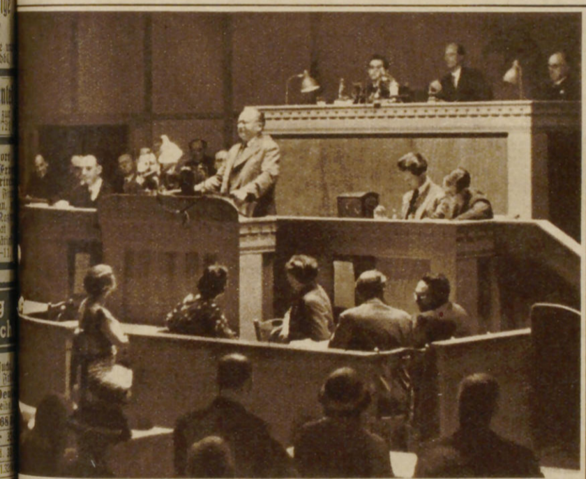
Polnischer Volkskommissar Litwinow bei seiner Antrittsrede im Völkerbund.