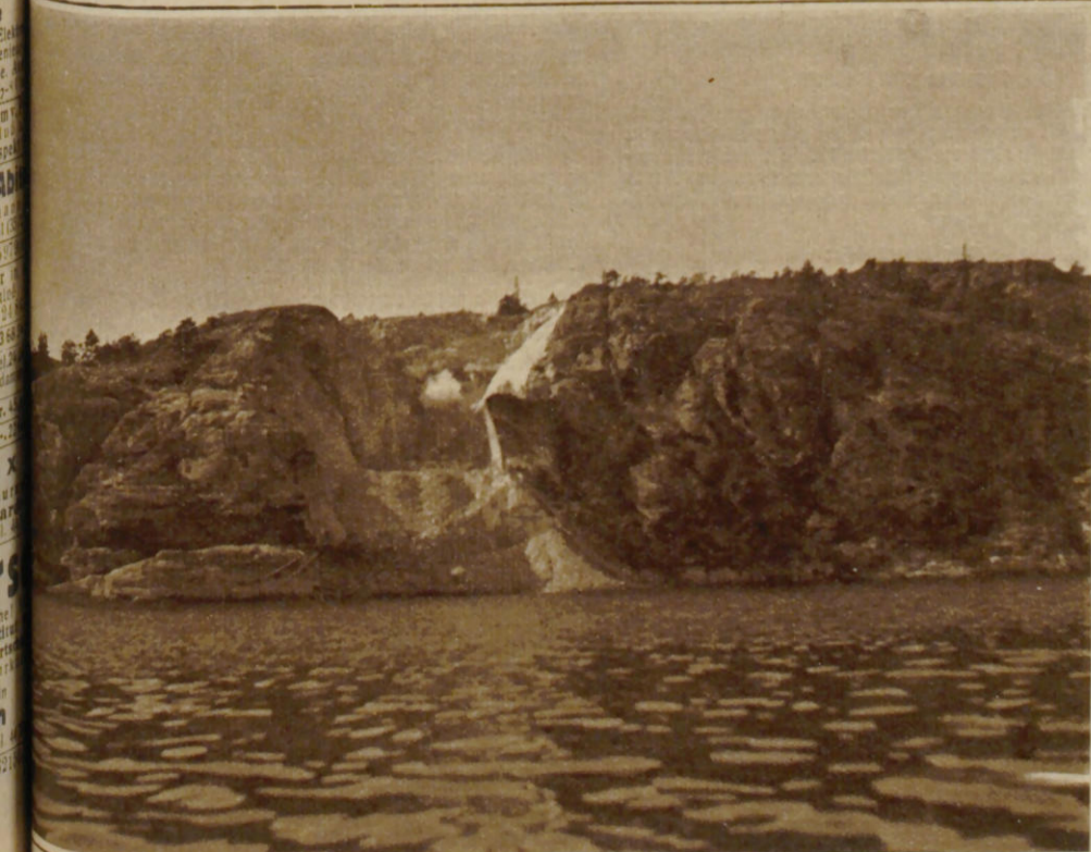
Eine Sprengstelle am Steilabhang der Felsen.