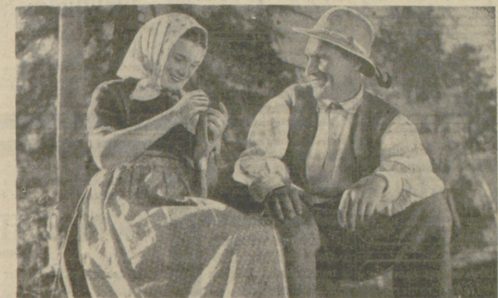
Morgen findet in Hamburg die Erstaufführung des neuen Luis-Trenker-Films „Der verlorene Sohn“ statt, der von der Filmprüfstelle das Prädikat künstlerisch und besonders wertvoll erhielt.