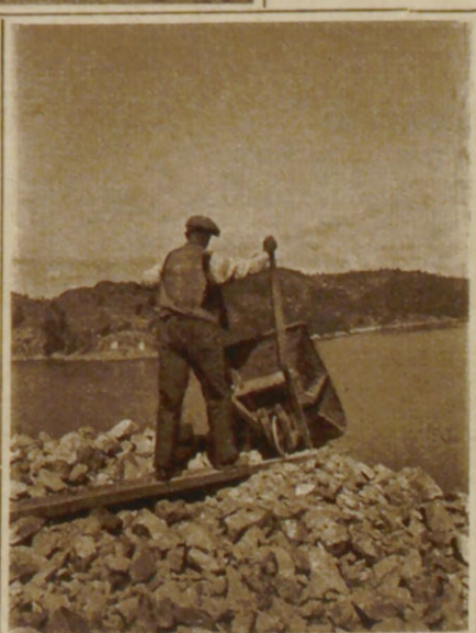
Das Quarzgestein wird auf die Halde geschüttet und von dort aus unmittel- bar verladen.