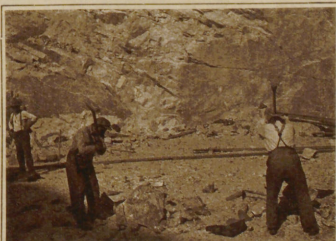
Die Quarzblöcke werden zerleinert.

Für die Glas- und Spiegelfabri- kation, zur Herstellung von Schmelzröhren und anderem chemisch-technischen Gerät ist die Kieselsäure ein wichtiges Ausgangsprodukt, das man in riesenhafte Mengen als Quarz im südlichen Norwegen findet. Diese uralten, abgeschliffenen Felsbuckel bestehen vielfach nur aus Quarz. An vielen Stellen der Küste findet ein umfang- reicher Abbau statt, der um so lohnender ist, als die große Wassertiefe zwischen den Schä- ren unmittelbare Verladung ins Seeschiff gestattet.