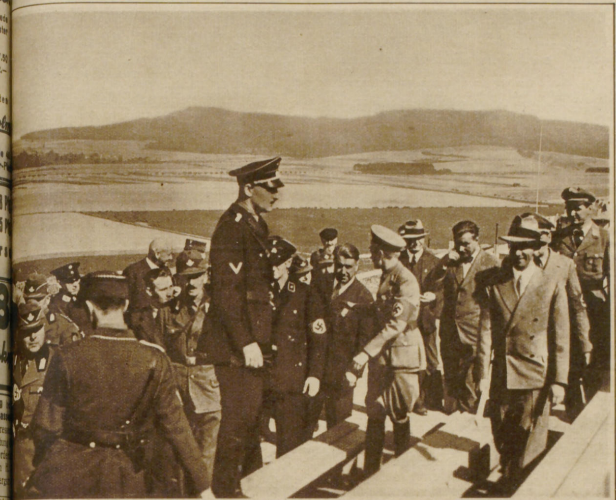
Reichsminister Dr. Goebbels bei einer Besichtigung des Versammlungsgeländes auf dem Bückeberg.

Für hervorragende Leistungen in Kupfertiefdruck • Großer Preis Turin 1911 • Gent 1913 106. Jahrgang * 3. Vierteljahr * 3. Beilage