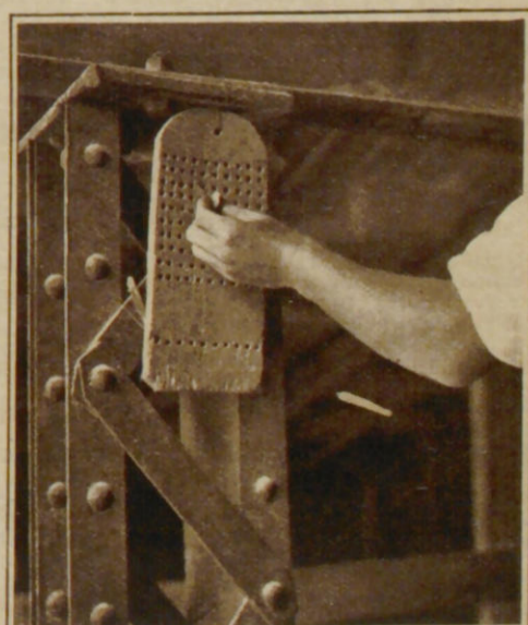
Das Zählbrett eines Arbeiters.