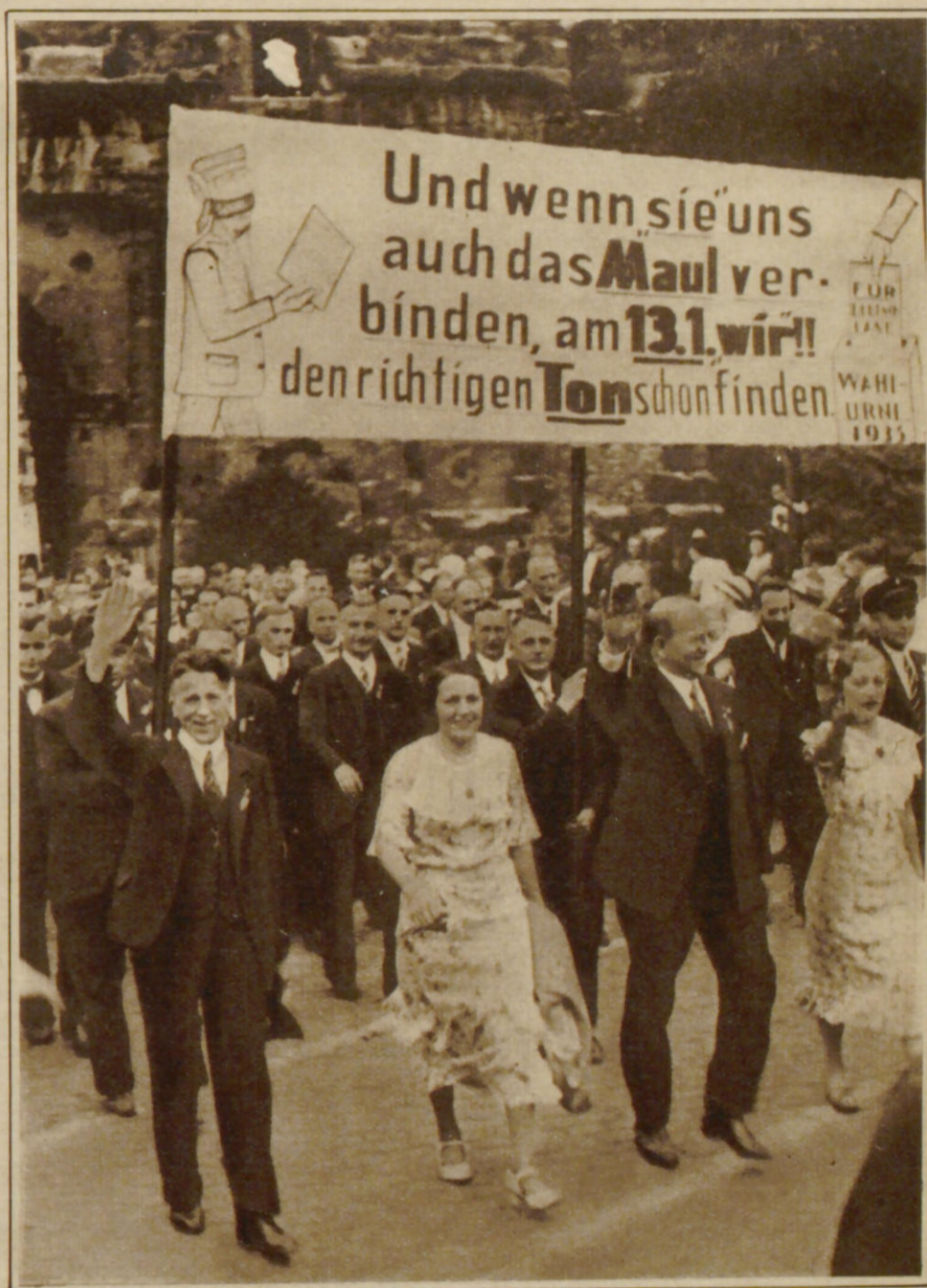
Einzug der Saarländer Sänger in Trier zum Deutschen Sängerfest.

Und wenn sie uns auch das Maul ver- binden, am 13.1. wir!! den richtigen Tonschön finden. WAHL URNEN 1935