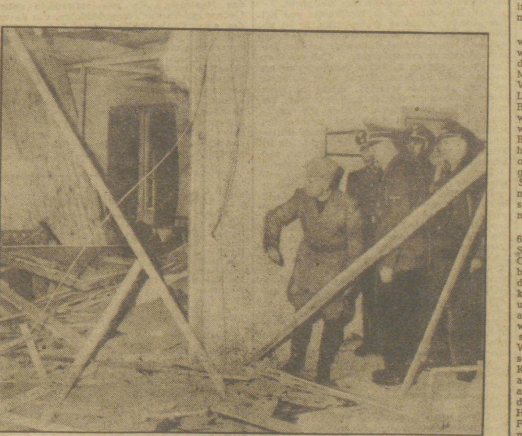
Zwei Funkbilder geben den ersten Eindruck vom Schauplatz des verbrecherischen Attentats auf den Führer. Links (unten) einen Blick in das Zimmer, in dem die Bombe explodierte. Der Kreis bezeichnet den Platz, auf dem der Führer bei der Explosion stand. Rechts: Kurz nach der Ankunft im Führerhauptquartier besuchte der Duce in Begleitung des Führers den Tatort.